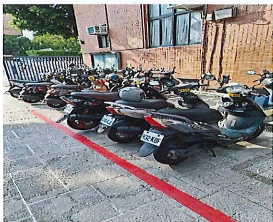
圖 1：機車車格外違規停車